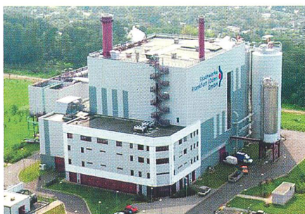
Viele deutsche Stadtwerke planen zurzeit, ein eigenes Kraftwerk zu bauen (Bild Kraftwerk der Stadtwerke Frankfurt/Oder).

Gegenwärtig produzieren laut Studie 11% der Stadtwerke Strom in eigenen Erzeugungsanlagen. Weitere 10% würden gemeinsam mit anderen Elektrizitätsunternehmen ein Kraftwerk betreiben. Drei Viertel der Unternehmen unterhalten dagegen keine eigenen Kraftwerke oder sind an anderen Stromerzeugungsanlagen beteiligt.