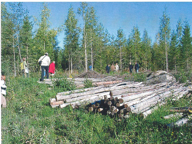
Steigende Preise auch für Energieholz.

Einheimisches Holz als Rohstoff und Energieträger wird in der Schweiz wieder vermehrt