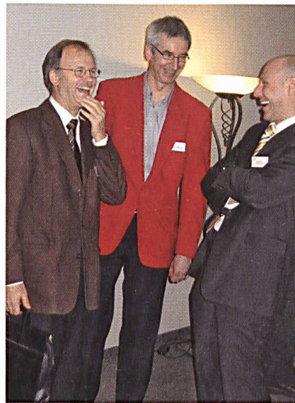
Ausgelassene Stimmung in den Pausen – L'ambiance débridée dans la pause

Ein weiteres Thema war das Altern der Kabel. Die Alterung wird nicht nur durch