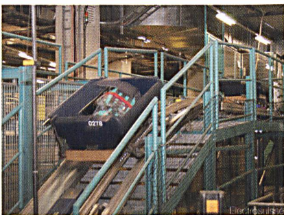
Linearmotoren treiben diesen Gepäckbehälter an – ein Teil der 20 km Bänder und Sortieranlagen zwischen Check-in und Flugzeugrumpf

mern für das internationale Gepäck kommen. Damals hätten sich die Koffer im Untergrund des Flughafens gestapelt. Nun sei auch diese Verbindung redundant geschaltet.