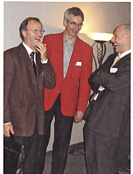
Ausgelassene Stimmung in den Pausen – L'ambiance débridée dans la pause

Ein weiteres Thema war das Altern der Kabel. Die Alterung wird nicht nur durch