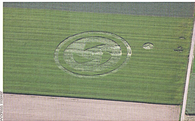
Kornkreis in Ettiswil (LU).

häufigsten treten Kornkreise in Südengland auf. Jeden Sommer entstehen neue Gebilde – immer grösser, immer komplexer und immer komplizierter. Sollten diese Kornkreise von Menschenhand gemacht worden sein, fehlt bis heute eine plausible Erklärung, welche Methode genau angewendet wurde. Erstaunlich ist, dass die Halme des Kornes manchmal in verschiedenen konzentrischen Kreisen umgelegt sind, wobei sie die Richtung jeweils abrupt wechseln – vom Uhrzeigersinn zum Gegenuhrzeigersinn und umgekehrt. So etwas über Nacht in so exakter Form herzustellen, ohne das ganze Kornfeld zu zertrampeln, ist eine reife Leistung. Merkwürdig auch, dass noch nie jemand in flagranti dabei ertappt wurde. Während einige an einen faulen Zauber glauben, der von Menschenhand gemacht wurde, neigen die anderen dazu, den Ursprung dieser Gebilde den Ausserirdischen zuzuschreiben. In beiden Fällen fehlt jedoch eine exakte Erklärung. (Andreas Walker/Sz)