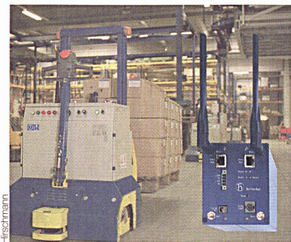
Der intelligente Hubstapler ist drahtlos vernetzt.

Der Anwender wird aber mit einer Unmenge von möglichen Technologien kon-