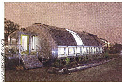
Futuristisches Solarhaus der University of Michigan.