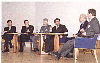
Der 1. Schweizerische Stromkongress Anfang 2007: Die Teilnehmer/innen waren mit den Referanten und Podiums- diskussionen sehr zufrieden.