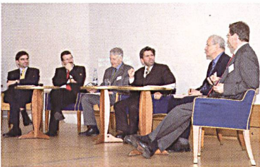
Der 1. Schweizerische Stromkongress Anfang 2007: Die Teilnehmer/innen waren mit den Referanten und Podiums- diskussionen sehr zufrieden.