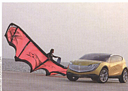
OttoCar Award: Präsenz von Mazda im «Second Life».

Am vergangenen Frankfurter Automobilsalon wurde der diesjährige Preis für die von Mazda Motor Europa geschaffene Insel «Nagare» in der virtuellen 3-D-Internet-Welt «Second Life» vergeben. Nagare Island wurde von Mazda Anfang Jahr entworfen, um bei Kite-Surfen – also bei Surfern, die sich von einem Lenkdrachen ziehen lassen – für den Mazda Hakaze zu werben. Die