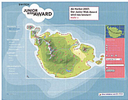
Auf der Website www.juniorwebaward.ch können durch Klicken auf die roten Punkte die eingereichten Projekte der einzelnen Schulklassen eingesehen werden.

Letztes Jahr wurde der Switch Junior Web Award erstmals ausgeschrieben. Die Idee, dass Schulklassen ihre eigene Website erstellen und im Internet veröffentlichen, fand breiten Anklang: Mehr als 100 Klassen mit rund 2000 Schülerinnen und Schülern kreierten 119 Websites. Sie lernten dabei den Umgang mit dem Internet, den Programmen und der Sprache und konnten Erfahrungen zum Thema Datenschutz