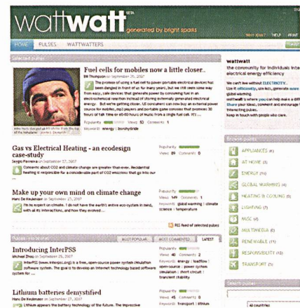
Die Homepage der neuen Website www.wattwatt.com .

Viele sind über die Auswirkungen menschlichen Handels auf das Erdklima besorgt und wüssten gerne, was der Einzelne dagegen unternehmen kann; Experten aus den verschiedensten Gebieten der Elektrotechnik haben innovative Verbesserungsvorschläge, wie der menschliche Einfluss reduziert werden kann: Für all jene hat die International Electrotechnical Commission (IEC) eine neue und unabhängige Internetplattform aufgebaut, auf welcher Diskussionen über elektrische Energieeffizienz geführt werden können.