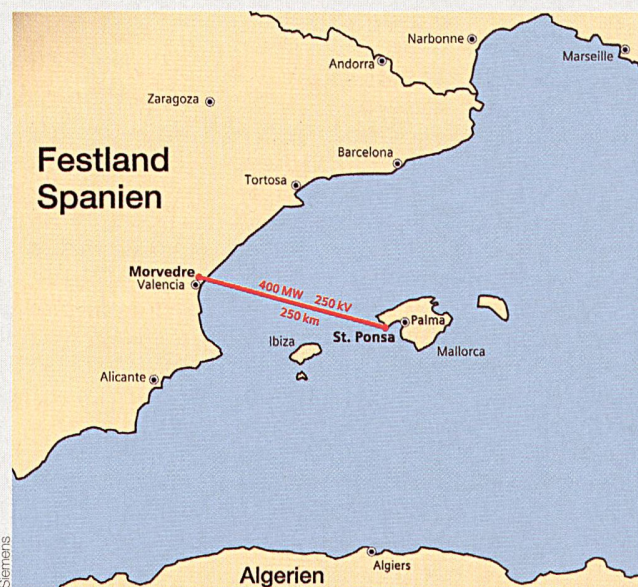
Die 250 km lange Seekabelverbindung wird von Mai 2011 an zwischen Morvedre bei Valencia und Santa Ponsa bei Palma de Mallorca 400 MW mit einer Übertragungsgleichspannung von 250 kV verlustarm übertragen.

Durch den Zugang zum Elektrizitätsmarkt des spanischen Festlandes kann der Spitzenlastbedarf der Insel vor allem in den heißen Sommermonaten – also zur Hauptferienzeit – zum ersten Mal durch Stromimporte aus dem europäischen Verbundnetz gesichert werden, der aus einem Energiemix von regenerativen und konventionellen Energiequellen besteht. Pro Jahr lässt sich so der Ausstoß von über 1,2 Megatonnen CO 2 vermeiden, die sonst beispielsweise durch den Bau eines neuen erdölbefeuerten 400-MW-Kraftwerks auf Mallorca zusätzlich emittiert würden. ( Siemens/Sz )