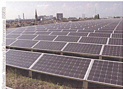
In Deutschland sind bereits rund 3 GW Fotovoltaikleistung installiert; die Schweiz liegt bei rund 30 MW. Im Bild: Fotovoltaikanlage mit 240 kWp auf dem Gründach der Messe Basel (2400 Siemens-SM-110-Panels, 7 Wechselrichter, Jahresertrag 220 000 kWh).

Solarstrom auf die Stromnetze hat und wie man diese Mengen noch erhöhen kann.