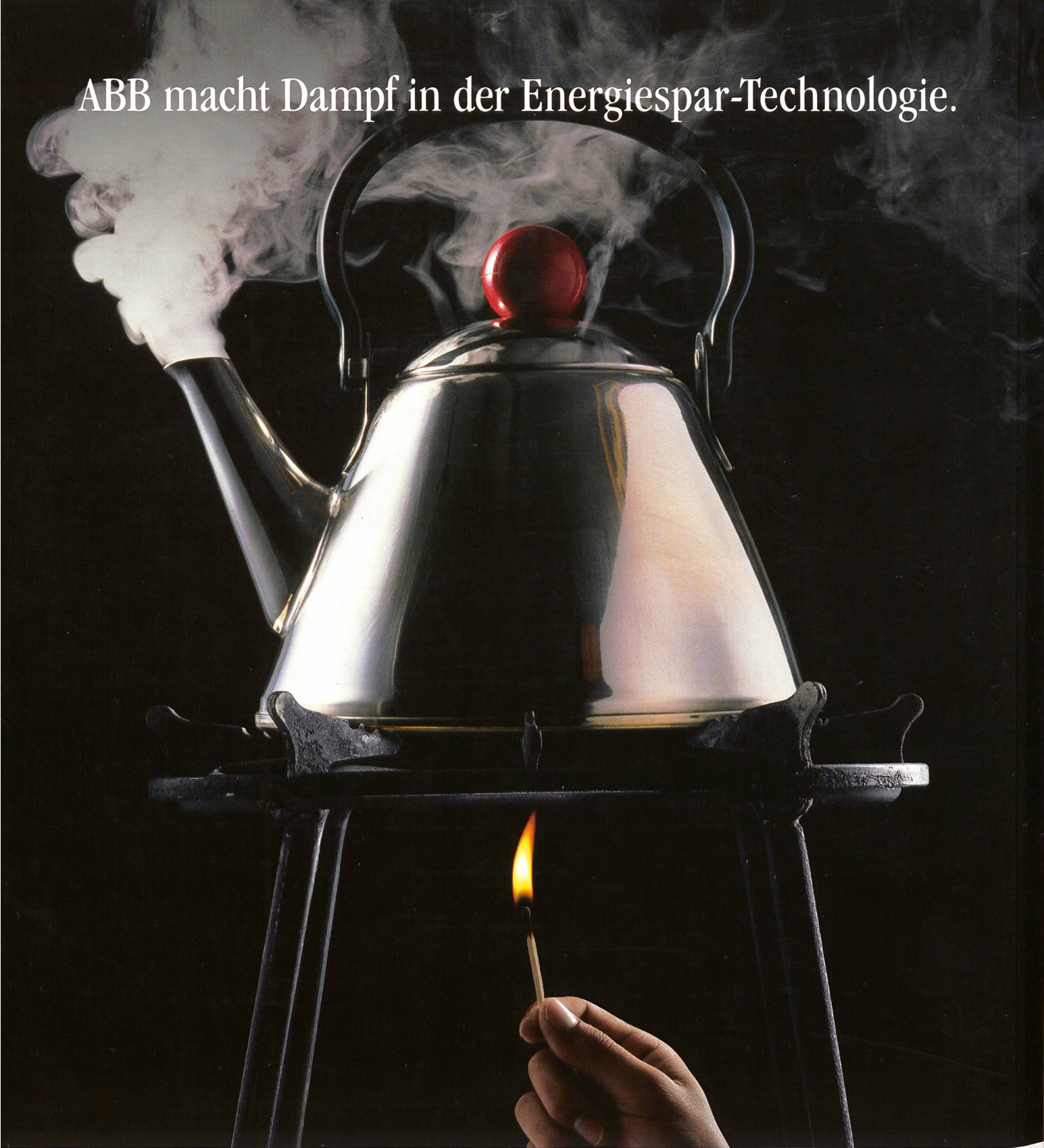
ABB macht Dampf in der Energiespar-Technologie.

Höhere Effizienz im Umgang mit Ressourcen bei gleichzeitiger Produktivitätssteigerung – ABB ist in der Schweiz auf diesem Weg mit weltweit führenden energiesparenden Lösungen dabei. Erfahren Sie mehr über ABB und ihre Energie- und Automatisierungstechnologien unter www.abb.ch