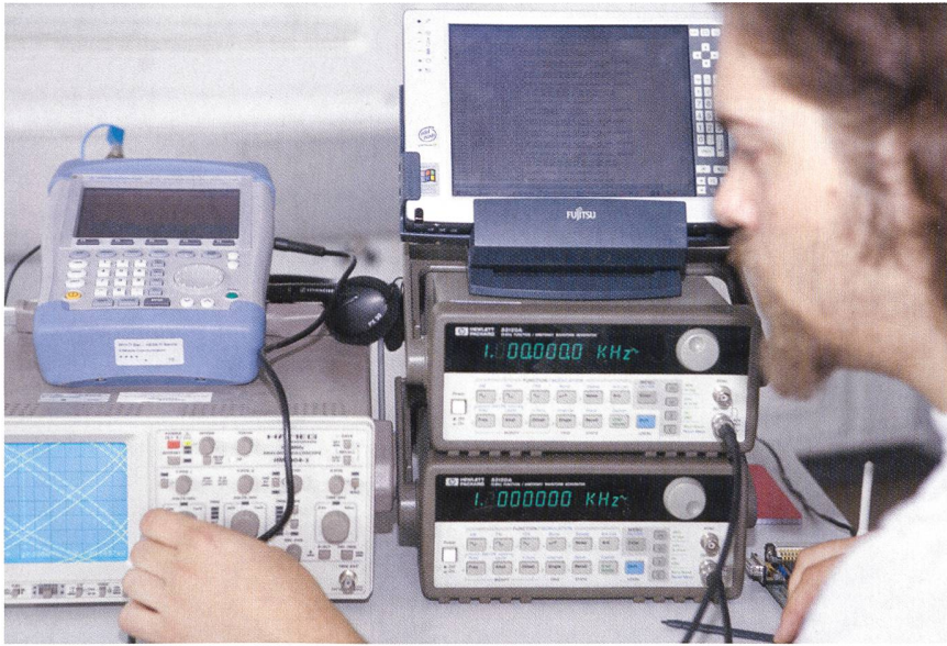
Wer sein Bachelorstudium mit einem guten Notendurchschnitt abgeschlossen hat, hat gute Chancen, zum neuen Masterstudiengang zugelassen zu werden.

den. Über den Erlass von ECTS-Krediten wird aufgrund der ausgewiesenen Leistungen wie z.B. Projektarbeiten und Weiterbildungen ebenfalls «sur dossier» entschieden.