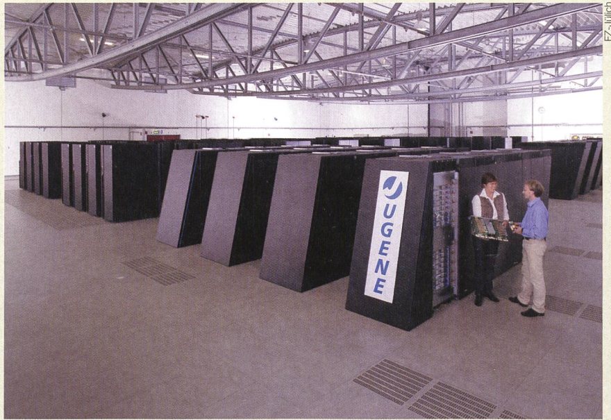
Ansicht des neu im Forschungszentrum Jülich eingesetzten Supercomputers Jugene.

Auf den Jülicher Supercomputern rechnen rund 200 europäische Forschergruppen. Er steht Forschern aus ganz Europa zur Verfügung.