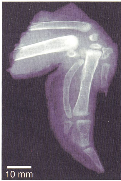
Links ein herkömmliches Röntgenbild eines Hühnerflügels. Mehr Details sieht man rechts auf dem Dunkelfeld-Röntgenbild.