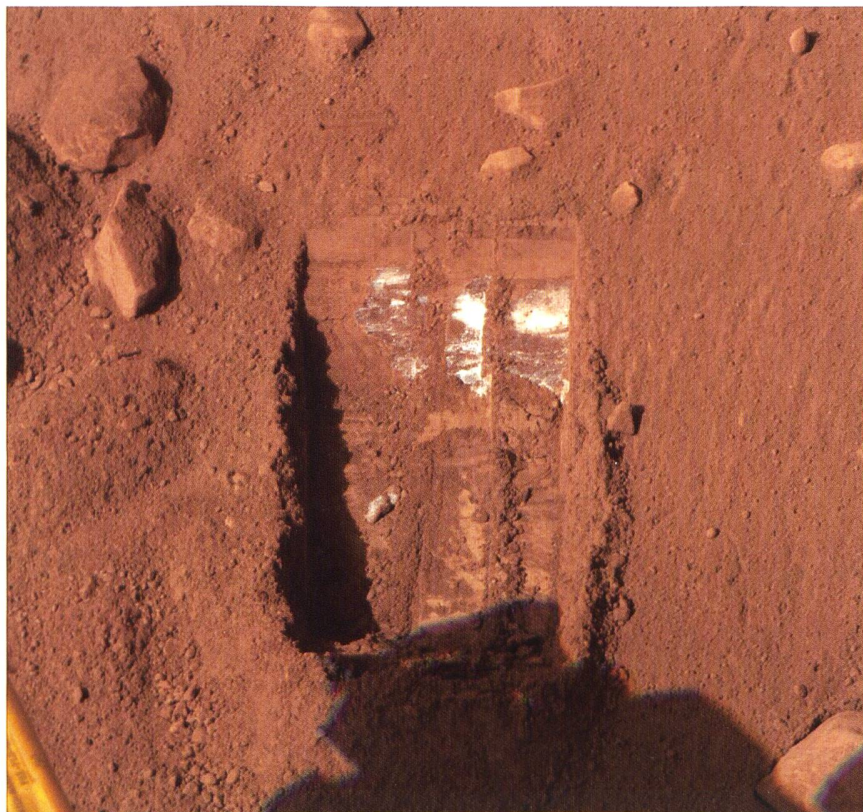
Pour le moment, on ne sait pas si la substance blanche est de la glace ou du sel.

Phœnix a atterri près du pôle Nord de Mars le 25 mai dernier après un voyage de 679 millions de kilomètres. Outre la recherche de glace, la sonde essaiera de détecter la présence de molécules organiques et éventuellement de traces de bactéries qui auraient pu se développer dans le passé, il y a 100 000 ans, quand de l'eau liquide existait sur la planète rouge. (Sciences et Avenir/gus)