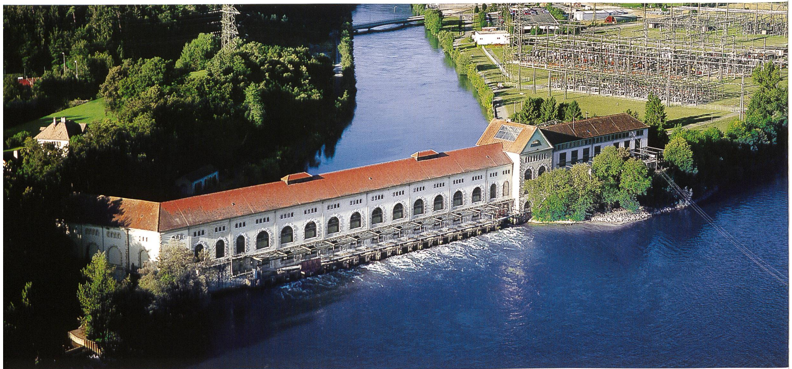
ABB Schweiz AG Brown Boveri Strasse 6 CH-5400 Baden Tel. +41 58 585 00 00 www.abb.ch

Unsere Produkte und Lösungen für die Energiotechnik der Zukunft leisten einen wichtigen Beitrag zur Erhaltung unserer Umwelt. Für ABB ist es ein erklärtes Ziel, bewährte Produkte und Systeme laufend weiter zu entwickeln und die Energieeffizienz stetig zu verbessern. Mit innovativen Technologien hilft ABB ihren Kunden die Produktivität zu steigern und dabei Kosten sowie Umweltbelastungen zu reduzieren. Setzen auch Sie uns unter Strom! www.abb.ch