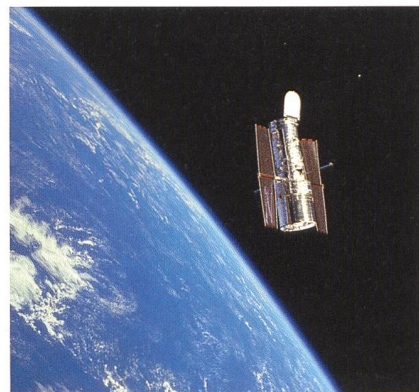
Das Weltraumteleskop Hubble, nachdem es von Claude Nicollier repariert wurde. Le télescope spatial Hubble après sa réparation par Claude Nicollier.