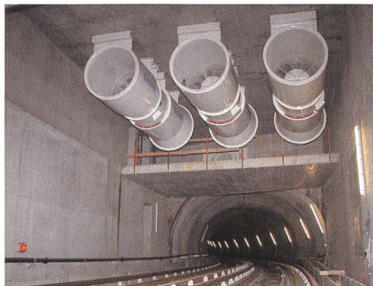
Le désenfumage du métro M2 à Lausanne.

L'objectif de cet après-midi est de mettre en évidence les défis rencontrés lors de la planification et de la réalisation du M2 en mettant l'accent sur les aspects de la sécurité et de l'énergie. La manifestation