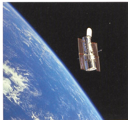
Das Weltraumteleskop Hubble, nachdem es von Claude Nicollier repariert wurde.