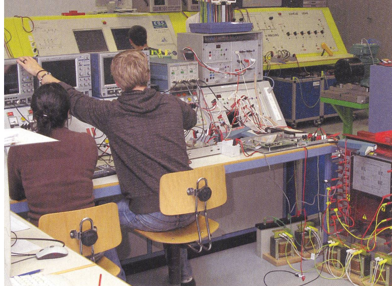
Diplomarbeit an einem Traktionstransformator im Labor für elektrische Maschinen.

Travail de diplôme sur un transformateur de traction au laboratoire des machines électriques.