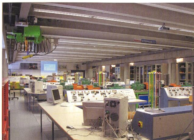
Le laboratoire des machines électriques et réseaux d'énergie de l'Ecole d'ingénieurs et d'architectes de Fribourg.