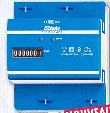
E-No 981 873 018 max. 3x65 A, 3x230/400 V Capot plombable