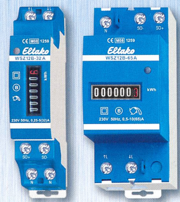
E-No 981 871 218 max. 1x32 A, 230 V E-No 981 871 318 max. 1x65 A, 230 V