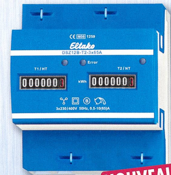
E-No 981 873 118 max. 3x65 A, 3x230/400 V avec double tarif Capot plombable