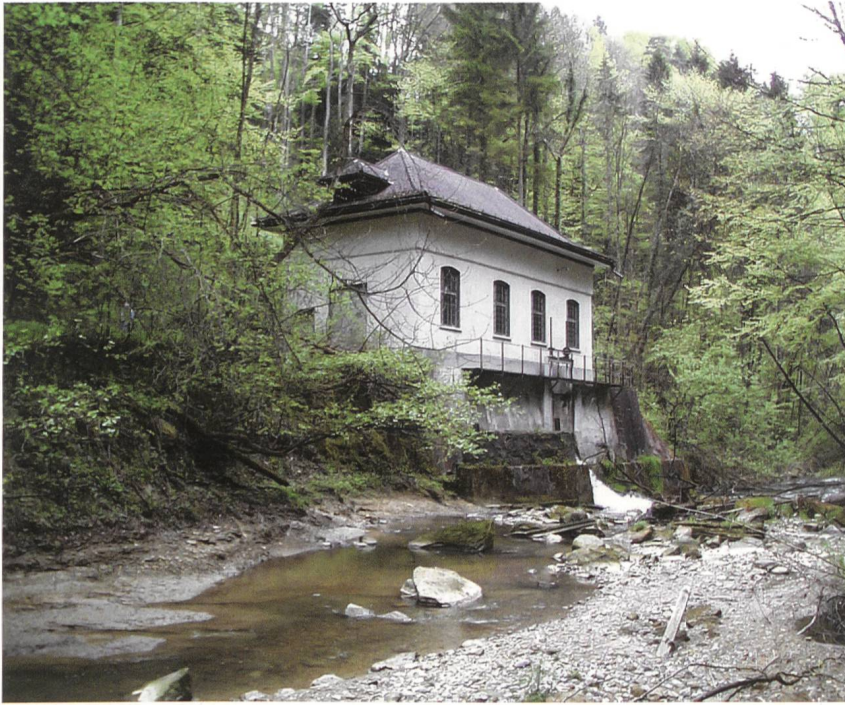
Turbinenhaus von 1903. Im historischen Turbinenhaus an der Steinach produziert die Stadt St. Gallen seit über 100 Jahren Strom aus Abwasser.

der Stromproduktion die geänderten rechtlichen Rahmenbedingungen. Gemäss dem neuen Stromversorgungsgesetz, das seit dem 1. Januar 2008 in Kraft ist, werden Betreiber von Kleinwasserkraftwerken für den ins Netz eingespeisten Strom kostendeckend vergütet. Die Höhe der Vergütung wird in Abhängigkeit der Anlagengrösse (elektrische Leistung), der Fallhöhe und der notwendigen baulichen Massnahmen abgestuft. Interessant ist, dass die Vergütung zu einem fixen Preis über 25 Jahre garantiert wird und die Einnahmen damit für den Betreiber kalkulierbar sind. Durch diese Änderung der Rechtsgrundlage gewinnt der Bau und Betrieb von Abwasserkraftwerken deutlich an Attraktivität. Insbesondere können fortan auch kleinere Potenziale mit Stromgestehungskosten über den bisher für die Vergütung gültigen 15 Rp./kWh wirtschaftlich genutzt werden. Dies wird mit Sicherheit dazu führen, dass der Bau von Anlagen in den nächsten Jahren zunimmt.