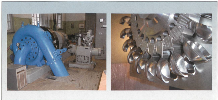
Abwasserturbine St. Gallen.

Links die alte Pelton-turbine, rechts ein Schaufelrad, wie es im neuen Kraftwerk zum Einsatz kommen wird.