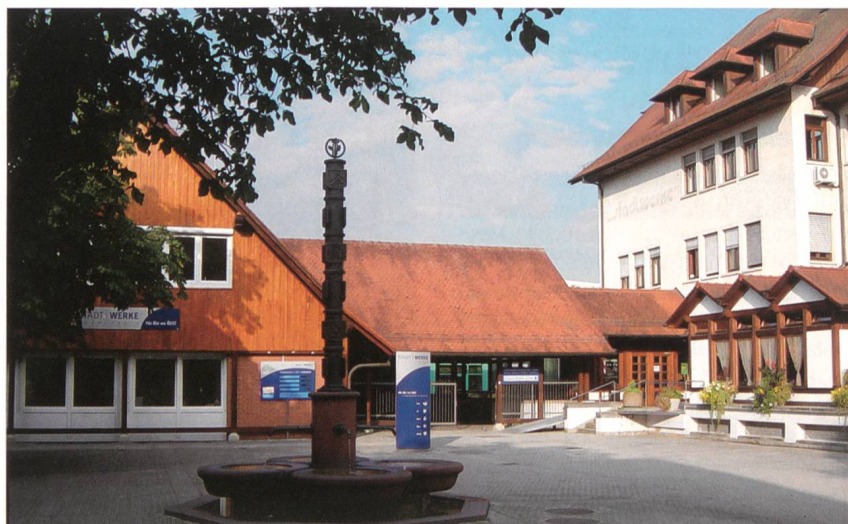
ArcFlow kommt in fast allen Abteilungen der Stadtwerke Radolfzell zum Einsatz.

ArcFlow AG, Lörenstrasse 15, 4658 Däniken www.arcflow.de, orga@arcflow.ch Tel. 062 288 10 20