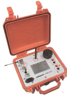
Phasenmessgerät PVS 100 von Interstar.

Das System Seba KMT PVS 100 von Interstar besteht aus zwei baugleichen Geräten. Eines davon wird als Basisstation konfiguriert und an einer Niederspannungs-Referenzphase angeschlossen. Zur Bedienung und Messwertanzeige dient ein vollgrafischer Touchdisplay. Die präzise Zeitbasis für die Synchronisation wird über GPS hergestellt. Für die Übertragung der Synchronisations-