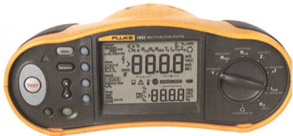
Fluke-Gerät der Serie 1650B von Distrelec.

Mit den robusten und handlichen Installationstestern von Fluke lassen sich elektrische Anlagen einfach auf ihre korrekte Ausführung und auf Kompatibilität zur schweizerischen NIV-Norm prüfen. Die Funktionen der Serie 1650 sind erweitert worden, z.B. die schnelle Hochstromprüfung mit 12 A (typisch bei 230 V), die variable Auslösestromereinstellung für FI-Schalter, die Gut/Schlecht-Beurteilung bei FI-Prüfung, die Anzeige der Netzspannung auf Knopfdruck (L-PE, L-N, N-PE), die Prüfspitze mit Starttaste, das Gerät braucht keine eigene Batterie und ist immer einsatzbereit, und ein Nullpunktadapter für genaue Kurzschlussstrom-Messungen dank einfachster Messleitungs kompensation.