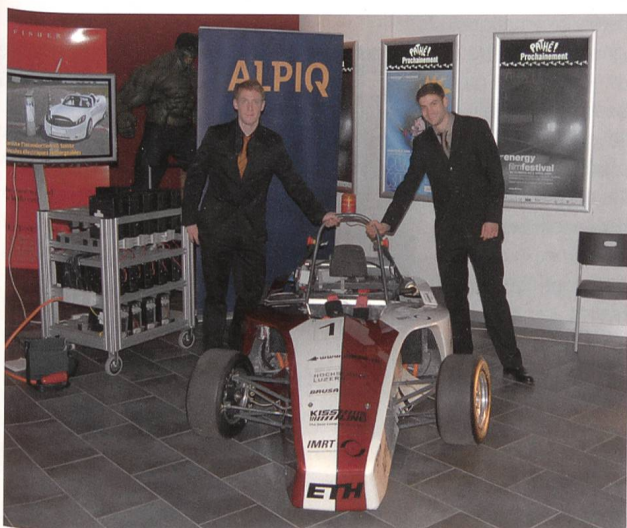
Véhicule de course hybride Hyb-Alpha de l'EPFL.

Du 31 mars au 3 avril 2009 s'est tenue à Lausanne la 12 e édition du FIFEL. Au programme de ce festival hors normes, des conférences publiques, la présentation de projets scientifiques de pointe et la projection d'une vingtaine de films. Sans oublier une matinée baptisée Planète Kids et dédiée aux écoliers du secondaire de Suisse romande.