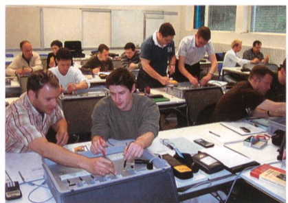
Im Kurs lernen die Teilnehmer die Messgeräte kennen.