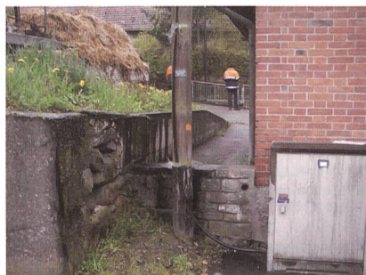
Mehrere Übungen werden 1:1 an einem realen Netz durchgeführt.

In Zusammenarbeit mit BKW FMB Energie AG wird der Verband Schweizerischer Elektrizitätsunternehmen wiederum 2 Kurse für Leitungskontrolleure mit Teilnehmenden aus dem gesamten deutschschweizerischen Raum und Lichtenstein durchführen.