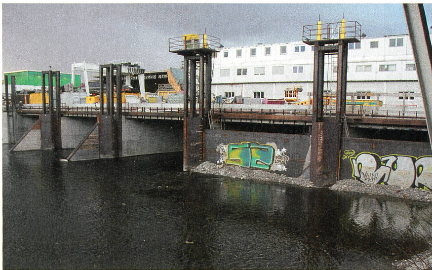
Links sind drei geflutete Sihlabschnitte zu sehen. In den zwei trockengelegten Abschnitten rechts wird zurzeit der Deckel des unterirdischen Bahnhofs Löwenstrasse betoniert.

Die ganze Durchmesserlinie ist 9,6 km lang, wovon 5,5 km unterirdisch und 1,5 km auf Brücken verlaufen. Das Projekt kostet 2 Mia. CHF und wird inklusive eines neuen Einkaufszentrums im Bahnhof Löwenstrasse 2015 fertiggestellt sein. Weitere Informationen gibt es unter www.durchmesserlinie.ch . CKe