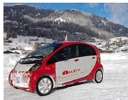
Mitsubishi i-MiEV am Autosalon bei E'mobile.

serstoff verwendet werden muss, dessen Speicherung in Fahrzeugen nicht unproblematisch ist. Bei heissen Zellen wird das problemlos mitführbare Methanol verwendet. Hier stellt die Aufwärmzeit der Zelle eine Schwierigkeit dar, besonders wenn Energie schnell benötigt wird. An diesen kurz skizzierten Beispielen lässt sich erahnen, dass es noch einiges zu tun gibt, bis ausgereifte Lösungen die nachhaltige Mobilität auch langstreckentauglich machen. Das IAMF hat einen nützlichen Überblick über die technischen Entwicklungen präsentiert. No