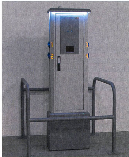
La construction des bornes de recharge est conforme aux normes européennes.

La borne de recharge électrique offre une sécurité maximale et dispose d'un certain nombre de caractéristiques techniques tout aussi utiles à l'utilisateur qu'à l'exploitant: indication de la consommation d'énergie et identification du véhicule, surveillance du processus de charge, système de lecture de cartes RFID, de bancomat ou de cartes de crédit, interconnexion avec d'autres bornes par LAN, WLAN ou fibres optiques, télémaintenance, etc., ne sont que quelques-uns des avantages de ce nouveau développement. Amperio/No