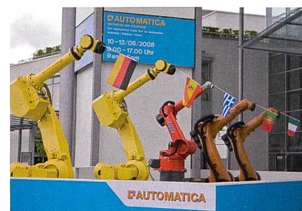
Automatica réunira plus de 470 exposants d'Allemagne et de l'étranger.

Le 4 e Salon international d'automatisme et de mécatronique aura lieu en juin à Munich. Il s'agit de la principale exposition européenne de la branche. Outre le plus grand assortiment de robotique du monde, les domaines suivants seront représentés à Automatica: les techniques d'assemblage et de manutention, de sécurité, de commande et d'alimentation, la technologie des capteurs ainsi que le traitement d'image industriel qui joue un