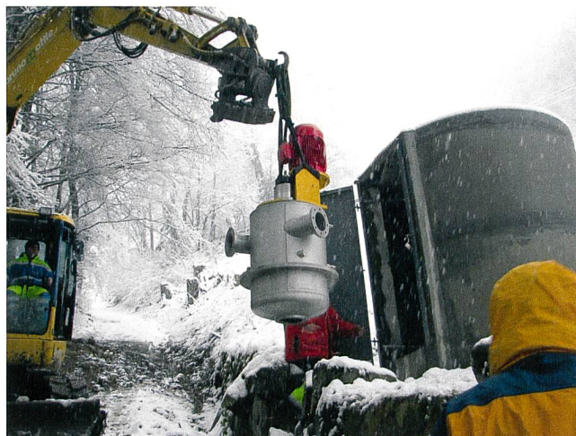
Bild 2 Einbau der Turbine in Druckbrecherschacht in Oberriet SG. Dank der kompakten Bauweise waren nur geringe bauliche Anpassungen der bestehenden Infrastruktur nötig.