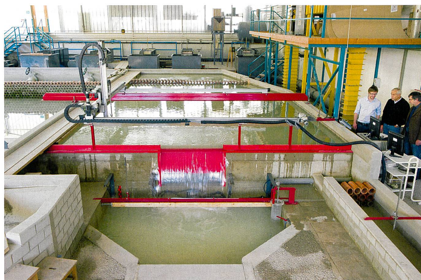
Modell des Schachtkraftwerks.

Damit können Investoren Standorte in den Blick nehmen, die bislang für die Nutzung der Wasserkraft kaum interessant waren.