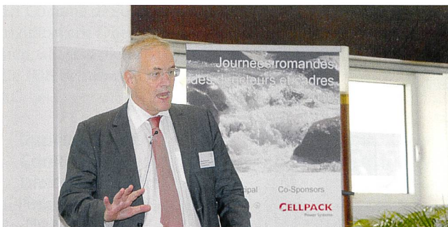
« L'écart entre les législations suisse et européenne à tendance à se creuser », a averti Walter Steinmann, directeur de l'OFEN.

Point d'orgue des JDC 2010, l'intervention de Walter Steinmann a permis aux participants de se rendre compte du chemin sinueux que la Suisse doit parcourir en vue de négocier au mieux le dossier énergétique avec l'Union européenne (UE). Pour le directeur de l'OFEN, « l'écart entre les législations suisse et européenne s'accroît. De plus, notre droit de participer aux institutions de l'UE est encore trop limité. Or, ce sont elles qui édictent les nouvelles règles du marché. » Raison pour laquelle le Conseil fédéral a récemment décidé l'adaptation du mandat de négociation avec Bruxelles. Celui-ci est désormais en consultation dans les cantons et les commissions de politique extérieure. Nicolas Geinoz