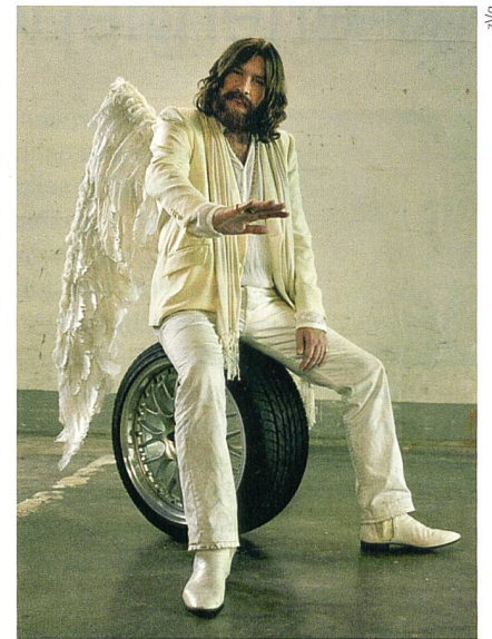
«Slow Down» – Botschaft mittels Symbolfigur.