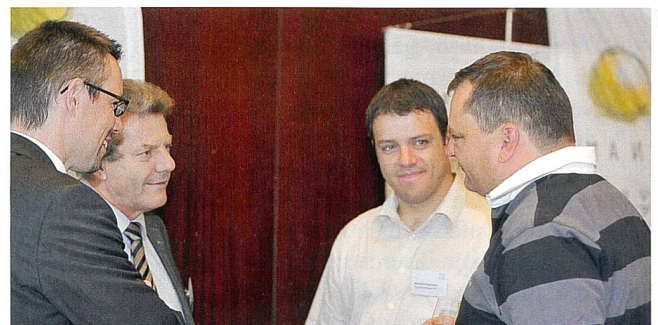
Les JDC incluent aussi des moments conviviaux, idéals pour développer son réseau.