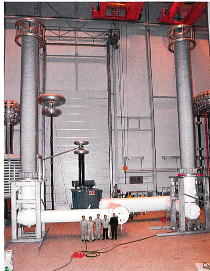
Die für China entwickelte 1100-kV-GIS-Schaltanlage demonstriert die Leistungsfähigkeit von GIS-Schaltanlagen.

Dass die kontinuierliche Verkleinerung der Komponenten nicht nur Vor-