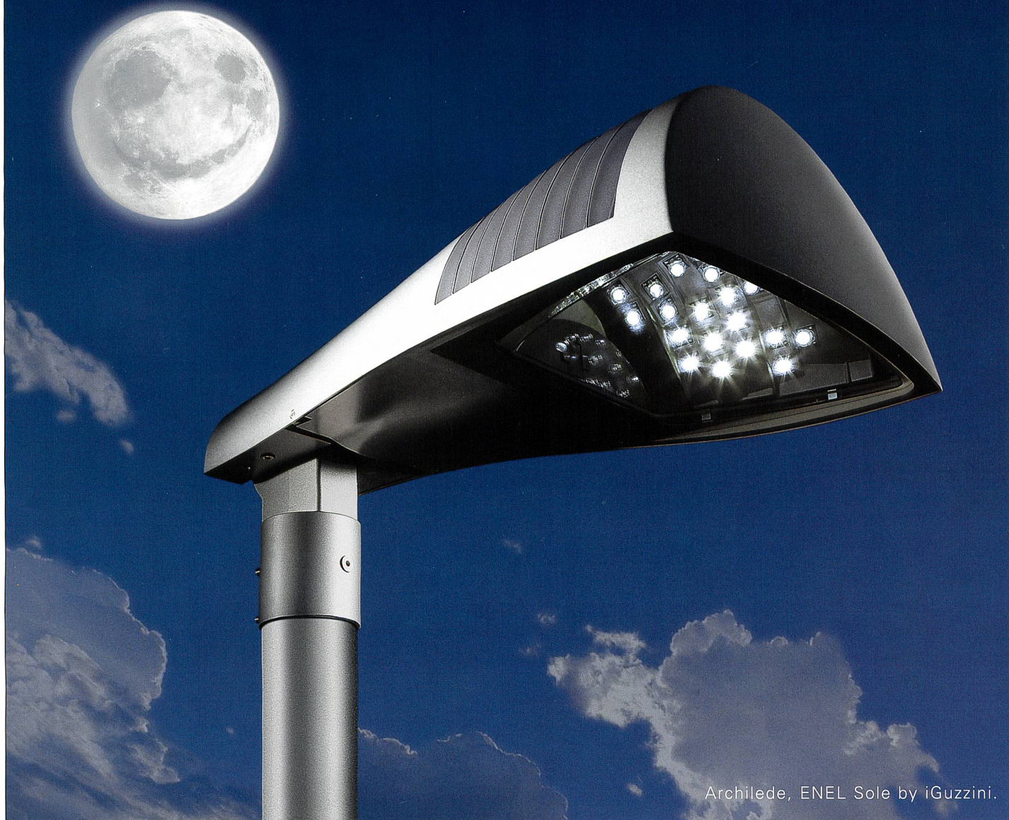
Archilede, ENEL Sole by iGuzzini.

Mit den neuen LED-Systemen, die iGuzzini für die Beleuchtung im öffentlichen Raum entwickelt hat, lässt sich der Stromverbrauch im Vergleich zu den allgemein gebräuchlichen Systemen drastisch senken (um bis zu 40%! ). Noch dazu verbessern sie die Lichtqualität und reduzieren die Umweltbelastung durch Lichtemissionen. Das tut nicht nur den Taschen der Bürger gut, sondern auch ihrem Wohlbefinden, ihrer Sicherheit und ganz nebenbei auch noch der Gesundheit des Nachthimmels, der in unserer heutigen Welt mit Millionen von Lichtern bombardiert wird.