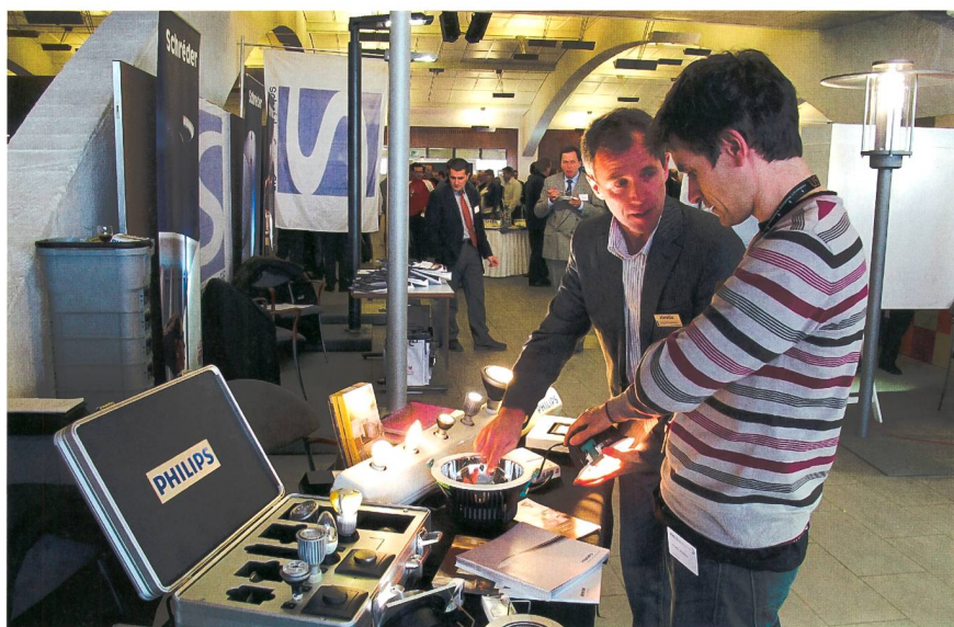
La pause de midi: le moment idéal pour se renseigner en toute tranquillité sur les nouveaux produits.