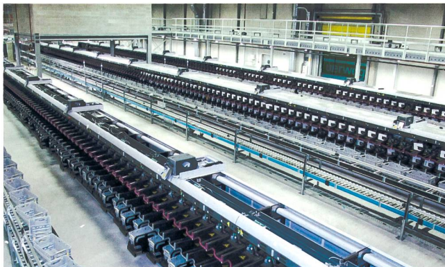
Trois des six machines de tri en fonction à Eclépens.