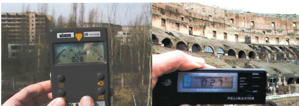
Bild 3 Strahlung in Pripjat (2008), rund 3 km vom Reaktor entfernt (links), und die natürliche Strahlung in Rom (Kolosseum).