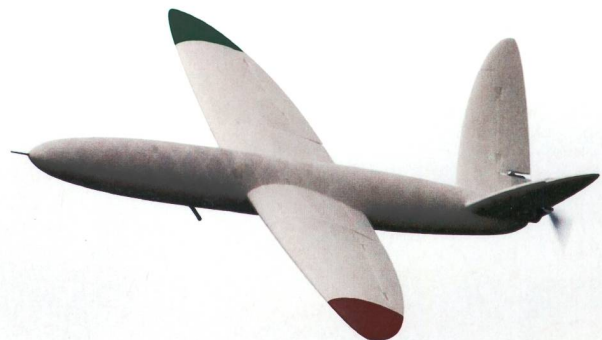
University of Southampton

Diese Produktionsform stösst auch in der Industrie bereits auf grosses Interesse. Im Februar dieses Jahres wurde bekannt, dass ein britisches Team der European Aeronautic Defence and Space Company (EADS) an der Entwicklung eines druckbaren Flügels für Jets arbeitet. No