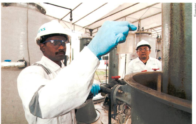
Die Pilotanlage, die energieneutral etwa 0,5 m 3 Abwasser am Tag reinigt, steht auf dem Gelände der Wasserwerke Singapurs.

Allerdings sind die Schmutzkonzentrationen in kommunalen Abwässern zu niedrig, um daraus wirtschaftlich Strom zu gewinnen. Die Entwickler von Siemens Water Technologies greifen deshalb zu einem Trick: Sie beladen die Bakterienflocken unter Luftzufuhr nur kurze Zeit mit den organischen Verunreinigungen, sodass sich die Bakterien kaum vermehren. Nach Abtrennung der grösseren Menge des Wassers vergären die Bakterien die Verunreinigungen anaerob, also ohne Luftzufuhr, zu Methan. No