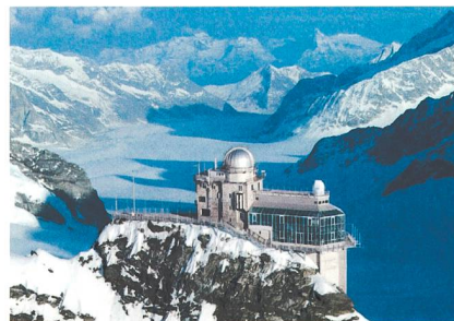
Forschungsstation Jungfraujoch auf 3580 m Höhe.

Insgesamt dürften sich die nicht rapportierten Mengen an «italienischem» HFC-23 auf 270 000 bis 630 000 t CO 2 -Äquivalent belaufen – etwa der jährliche CO 2 -Ausstoss einer Stadt mit 75 000 Einwohnern. «Erfreulich ist dagegen, dass wir vom Jungfraujoch aus Emissionsquellen «sehen», die mehrere Hundert Kilometer entfernt sind», so Reimann. Um derartige Analysen global zu erheben, müsste allerdings das Netzwerk der Messstationen vor allem in Osteuropa und Ostasien ausgebaut werden. No