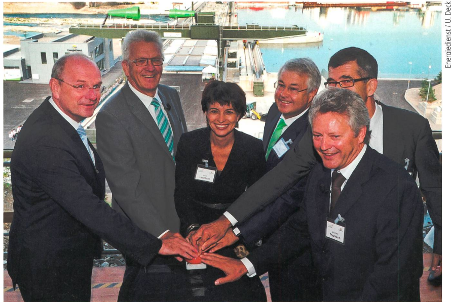
In guter Stimmung: Doris Leuthard drückt in illustrierter Gesellschaft symbolisch den Startknopf.

Mit jährlich 600 Mio. kWh ist die Produktion im Vergleich zum alten Kraftwerk mehr als verdreifacht worden. Die Anlage, welche bereits seit Ende letzten Jahres in Vollbetrieb läuft, verschlang rund 380 Mio. Euro. 2012 sollen auch die Renaturierungsmassnahmen abgeschlossen sein, darunter ein 900 m langes Aufstiegs- und Laichgewässer. Mn