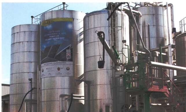
Figure 2 Les cuves de goudron de l'entreprise Colas sont chauffées à 180°C.