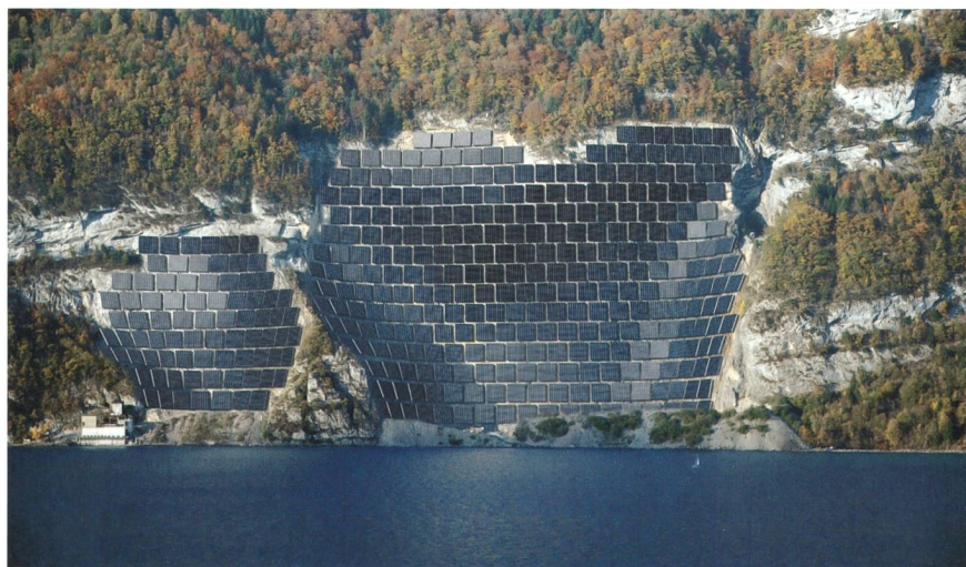
Im stillgelegten Steinbruch am Nordufer des Walensees soll möglicherweise eine Fotovoltaik-Anlage mit 9 MW Leistung zu stehen kommen. (Fotomontage)

Die Anlage ist als Zwischennutzung der kahlen Felswand während 25–30 Jahren geplant und könnte sogar Vorteile für die Renaturierung bieten. Denn Bepflanzungsversuche waren wenig erfolgversprechend. Den grössten Erfolg erwartet man durch die natürliche Besiedlung mit Pionierpflanzen, die nach und nach eine Humusschicht bilden. Dieser Vorgang würde mit der Beschattung durch die Solaranlage begünstigt: Das Wasser verdunstet weniger schnell und die Temperaturen sind viel niedriger. Mn