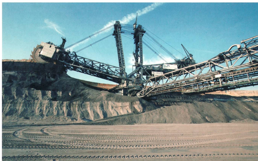
Braunkohle trug 24,6% zum deutschen Strommix bei (Bild: Abbau in Garzweiler).

Grösste erneuerbare Energiequelle in Deutschland war der Wind mit 7,6% (6,0%), gefolgt von Biomasse mit 5,2% (4,4%), Fotovoltaik mit 3,2% (1,9%) und Wasserkraft mit 3,1% (3,3%). Mn