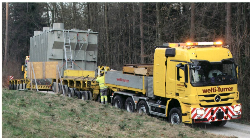
Der besonders auf der Waldstrasse beim Unterwerk anspruchsvolle Transport verlief ohne Zwischenfälle.

Mit der neuen Anlage steigt die Versorgungssicherheit in der Nordwestschweiz deutlich: Bisher separierte Netzteile von IWB, EBM, Alpiq und weiteren lokalen Stromversorgern können künftig leichter zusammengesaltet werden. Damit kann im Falle einer Netzstörung der benachbarte Stromversorger rasch Leitungen zur Verfügung stellen, um die Störungsstelle zu umgehen. Hierbei spielt auch der neue Transformator eine Rolle: Wo bisher ein Trafo die gesamte Spannungsumwandlung vom Übertragungs- auf die Verteilnetze übernommen hat, teilen sich künftig zwei diese Aufgabe. No