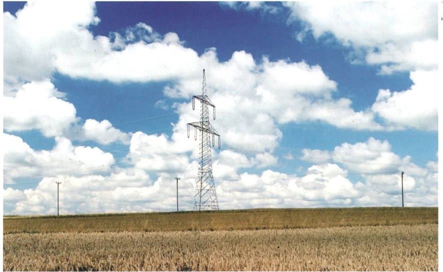
Deutsche Übertragungsleitungen: Die Regulierungsbehörde fordert einen raschen Ausbau.

Deutsche Unternehmen müssen Aufträge bei konventionellen Stromerzeugungsanlagen und beim Stromgrosshandel nicht mehr öffentlich ausschreiben. Die Europäische Kommission hat einen Antrag des Bundesverbandes der Energie- und Wasserwirtschaft gutgeheissen. Der Antrag war damit begründet worden, dass im Grosshandel für Strom hinreichend Wettbewerb herrsche. Mn