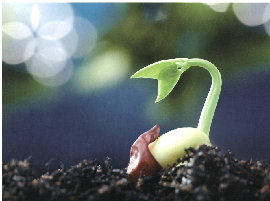
Akzeptanz ist ein zartes Pflänzchen und schneller verdorrt als aufgezogen.