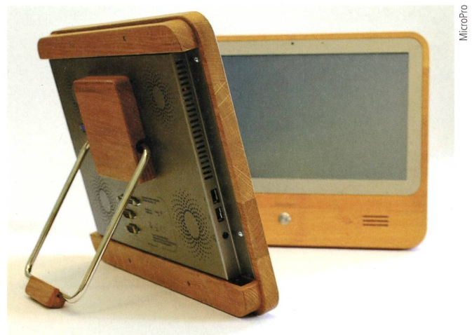
Der umweltschonende Touchscreen-PC Iameco mit Holzgehäuse.

Auf schädliche Stoffe haben die Hersteller weitestgehend verzichtet und halogenierte Flammhemmer zum grössten Teil durch weniger umweltschädliche Chemikalien ersetzt. No