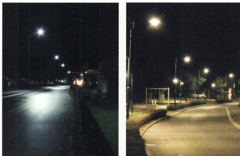
Figure 3 En 2015, les lampes à vapeur de mercure et certaines lampes à vapeur de sodium haute pression disparaîtront de l'éclairage public. Elles commencent à être remplacées par des LED froides (image de gauche) (smart lighting). Une alternative consisterait à utiliser des lampes à vapeur de sodium performantes (image de droite).

Au rythme où apparaissent aujourd'hui les nouvelles sources lumineuses, il est légitime de se demander comment se font ces tests et ce qu'ils signifient. Il peut être tentant pour le constructeur d'attribuer aux lampes qui contiennent généralement plusieurs LED la durée de vie de la LED isolée fonctionnant à 25°C. Des mesures effectuées sur des systèmes d'éclairage courants ont montré que dans des cas extrêmes les LED peuvent perdre plus de 70% de leur luminosité après 1000 h de fonctionnement [11]. Les