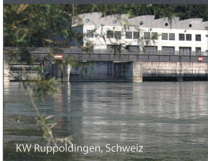
KW Ruppoldingen, Schweiz