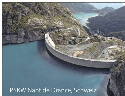
PSKW Nant de Drance, Schweiz