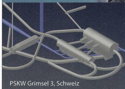
PSKW Grimsel 3, Schweiz