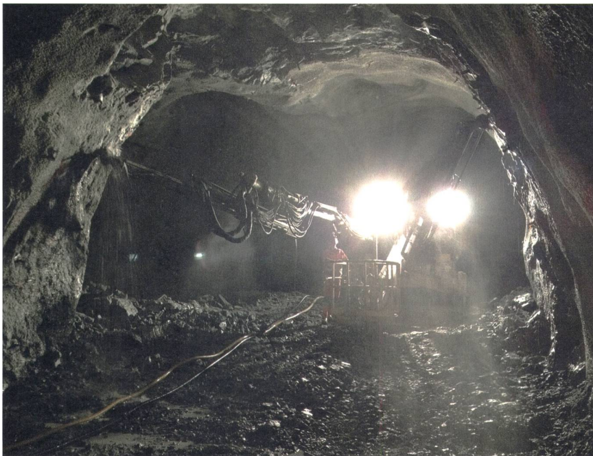
Bild 2 Bauarbeiten im Abschnitt vom Wasserschloss Kapf zum Kraftwerk Innertkirchen 1.

weitgehend abgeschlossen, so wurde etwa die Leittechnik einer umfassenden Revision unterzogen.