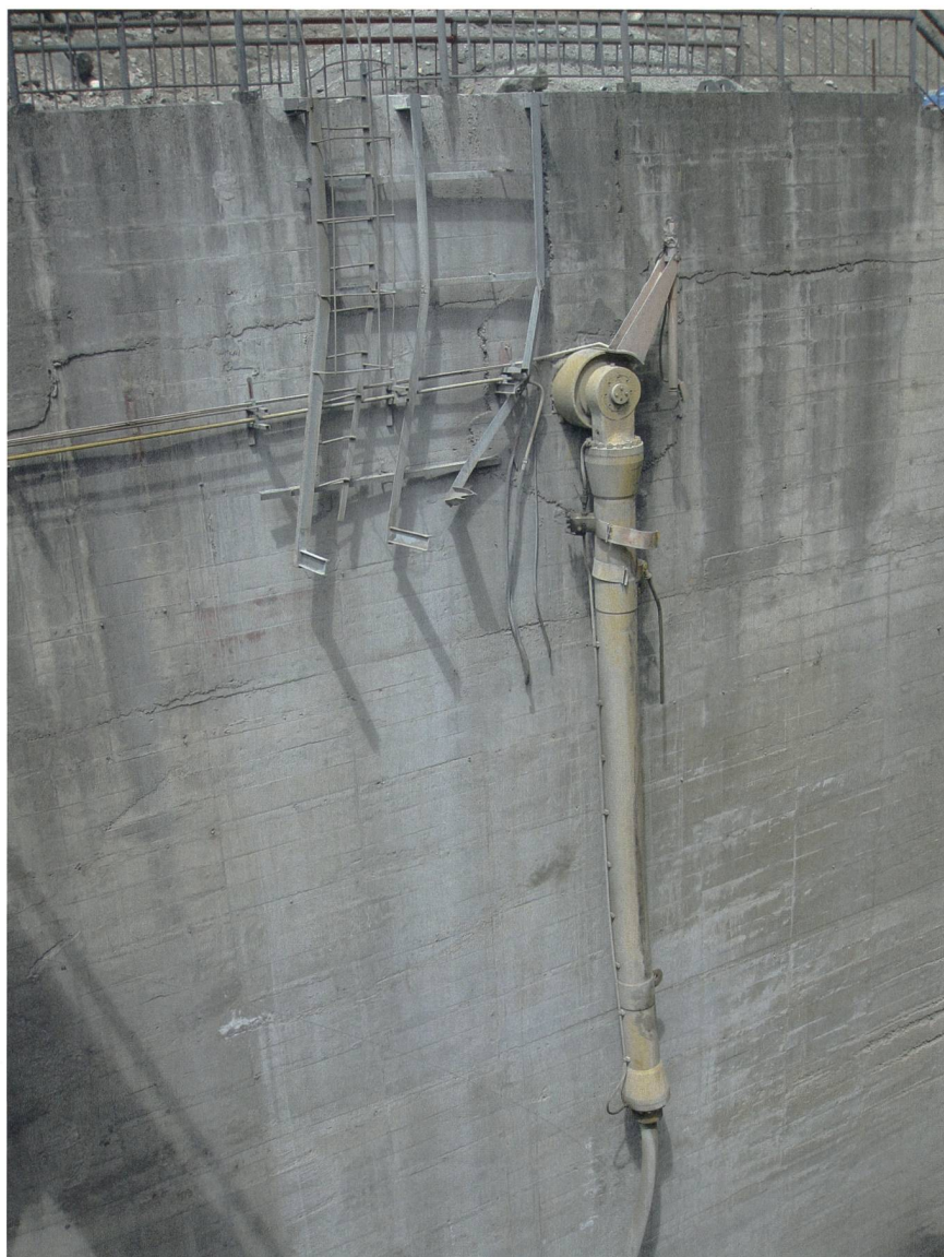
Bild 3 Durch Steinschlag zerstörte und weggeschwemmte Schütze eines Flusskraftwerks; nur der Hydraulizylinder ist übrig geblieben (Wenchuan-Erdbeben 2008, Sichuan, China).

■ Strukturelle Sicherheit. Bemessung der Stauanlage nach dem Stand der Technik und den einschlägigen Normen und Vorschriften. Massgebend ist die Hochwasser- und Erdbebensicherheit.