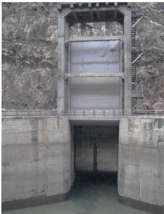
Bild 4 Durch Steinschlag beschädigte Tafelschütze eines Flusskraftwerks (Wenchuan-Erdbeben 2008, Sichuan, China).