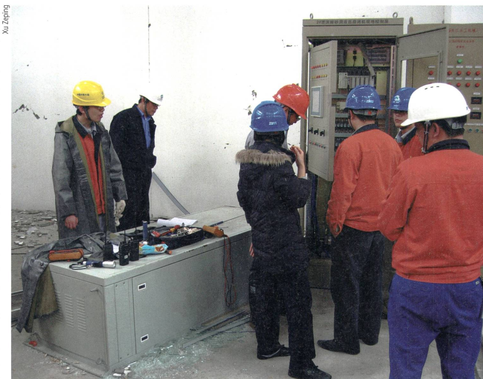
Bild 1 Umgestürzter Schaltschrank zur Bedienung der Hochwasserentlastung des Zipingpu-Damms (Wenchuan-Erdbeben 2008, Sichuan, China).

Nach dem Sicherheitsbeben müssen die sicherheitsrelevanten hydromechanischen Komponenten einer Stauanlage (Grundablass und Schütze der Hochwas-