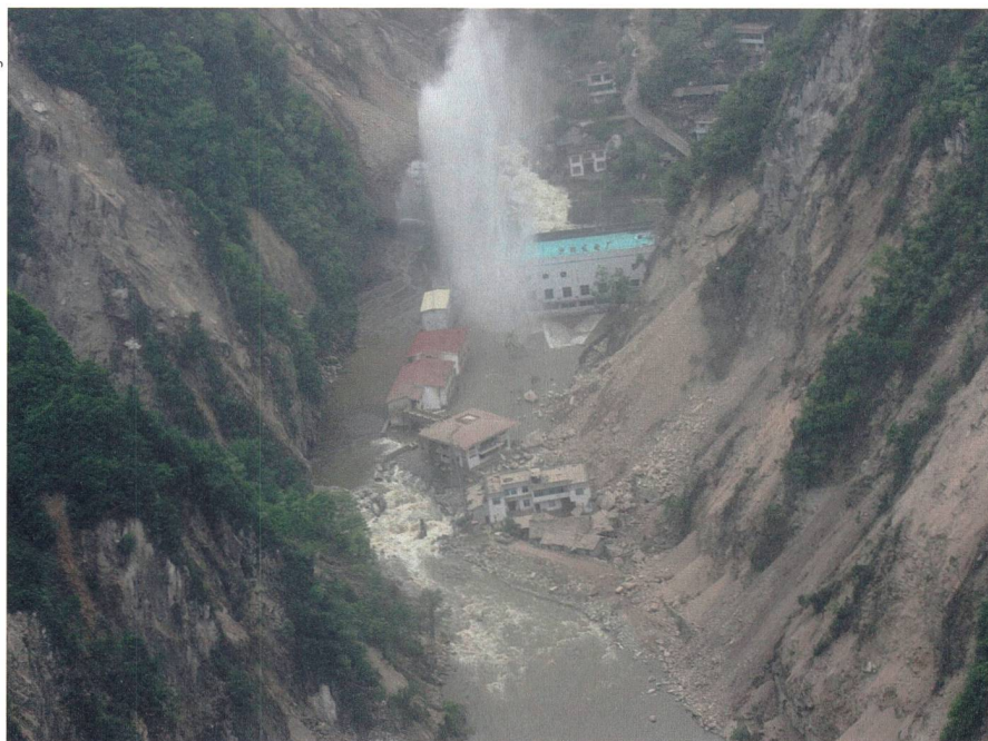
Bild 5 Versagen der Druckleitung der Shapai-Stauanlage verursacht Fontäne und Überschwemmung des Maschinenhauses, der umliegenden Gebäude und der Schaltanlage (Wenchuan-Erdbeben 2008, Sichuan, China).

und von Sicherheitserdbeben zu berücksichtigen [1].