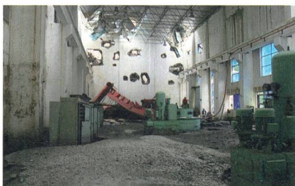
Bild 6 Überschwemmtes Maschinenhaus der Shapai-Stauanlage und Beschädigung der Stirnwand und Dachkonstruktion sowie des Krans durch Steinschlag (Wenchuan-Erdbeben 2008, Sichuan, China).

Zur Zeit des Bebens war der Zipingpu-Stausee nur rund 30% voll und stellte keine Gefahr für die Bevölkerung dar. Kurz nach diesem katastrophalen Beben, das rund 86 000 Menschenleben forderte, gab es jedoch ein Hochwasser, und der Stausee konnte wegen des umgestürzten Schaltschranks nicht mehr kontrolliert werden, da die Schütze nicht mehr bedient werden konnten. In relativ kurzer Zeit wurde deshalb kurz nach dem Beben aus einer sicheren Stauanlage eine unsichere. Die Techniker versuchten deshalb in den folgenden Tagen,