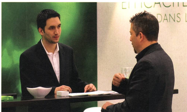
Les visiteurs d'Energissima ont pu profiter de la présence d'une quarantaine d'exposants, actifs notamment dans les domaines des énergies renouvelables et de l'optimisation des ressources.

La prochaine édition du SELD aura lieu au printemps 2014 et celle du salon Energissima en 2015. Cynthia Hengsberger