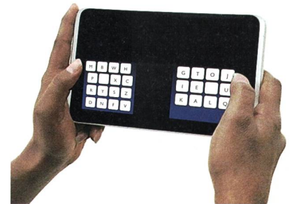
Max-Planck-Institut für Informatik

Die Autoren haben eine Fehlerkorrektur auf Grundlage der Wahrscheinlichkeitstheorie entwickelt, die sowohl die Daumenbewegung als auch statisti-