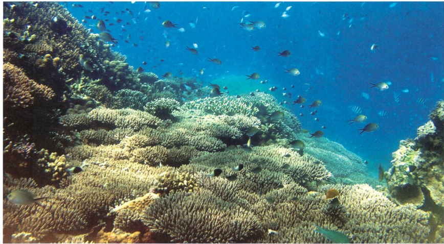
H. Reuter, ZMT

De véritables récifs de Zanzibar avec leurs espèces de corail et d'algue les plus répandues ont été modélisés pour effectuer la simulation. Ce modèle permet aux chercheurs d'exposer les récifs virtuels à différentes nuisances et d'examiner comment ils se développent pendant des dizaines d'années dans de telles conditions. La simulation a pour but de proposer une base destinée à la gestion des littoraux. Un ensemble de données complet relatif à la croissance, à la reproduction et à l'interaction entre les organismes des récifs, récolté sur des récifs du monde entier, a été intégré dans le développement du programme.