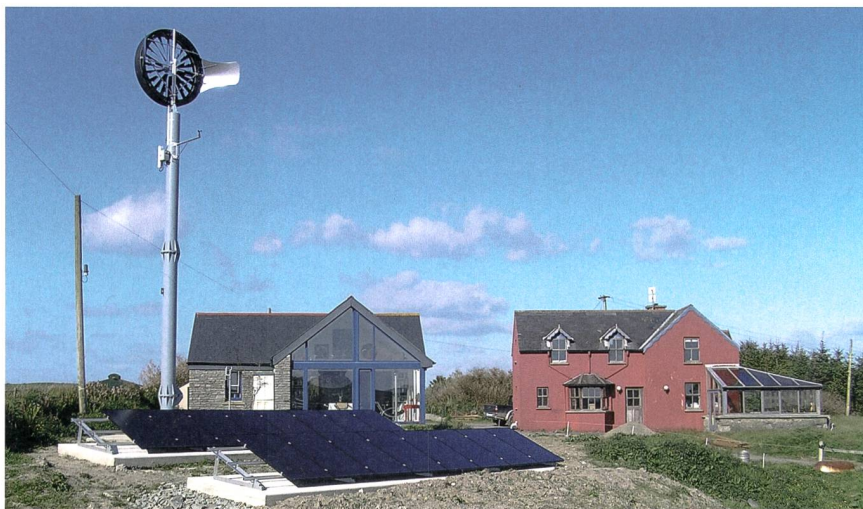
Eine Hybrid-Anlage in Irland kombiniert Wind- und Solarenergie.

Clever Grid (Schweiz) GmbH, Baarerstrasse 75, 6300 Zug Tel. 043 300 13 23, www.clevergrid.com