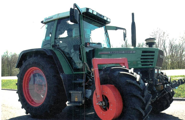
Université de Hohenheim, Institut de technologie agricole