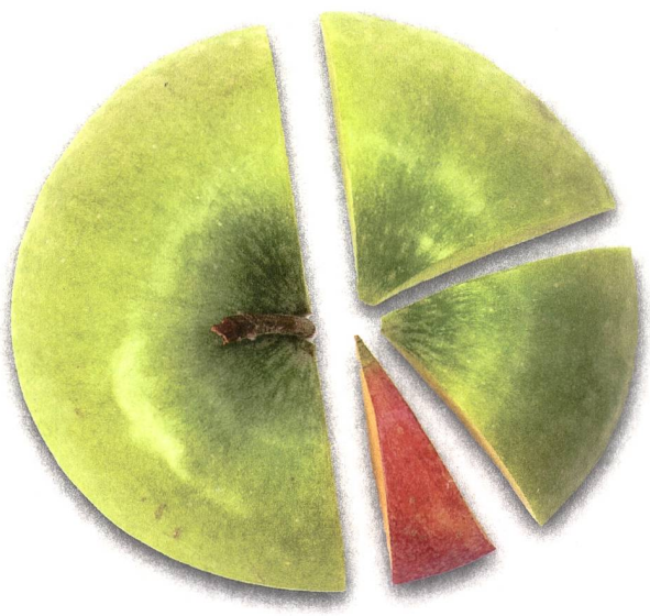
Bild 2 Der Anteil an «Nicht überprüfbaren Energieträgern» in den Stromkennzeichnungen sinkt.

Versorger, welche die Stromkennzeichnung als zusätzliches Positionierungsmerkmal und nicht als gesetzliche Verpflichtung verstehen, gehören ebenfalls zu den Nutzniessern. Im Stromvertrieb ist eine Differenzierung des Angebotes sowie die Abgrenzung zu Mitbewerbern naturgemäss schwierig. Eine professionell dargestellte Stromkennzeichnung ist ein kostengünstiges Mittel, um gegenüber den Kunden das gewünschte Image zu bestätigen. Dabei stehen nicht die Zahlen des Strommixes im Vordergrund, sondern eine gut lesbare und verständliche Stromkennzeichnung im Sinne einer aktiven Kundeninformation.[1] Dank der Kennzeichnung können sich Versorger mit geringem Aufwand vom Durchschnitt abheben.