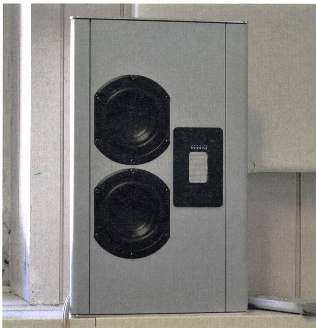
Bild 5 Unverkennbar Piega: Im universell einsetzbaren AP3 ermöglichen LDR-Bändchenhochtöner und das Aluminiumgehäuse einen grossen Sound aus relativ kleinen Lautsprechern.

Rund 20 Mitarbeiter sind bei Piega in Produktion und Administration tätig, wobei der Aussendienst und Vertrieb, auch von Marantz-Produkten, eine zunehmend grössere Rolle spielen. Rund 14000 Lautsprecher verlassen jährlich den Zürichsee – ein Drittel davon bleibt in der Schweiz, der Rest wird exportiert. Der Export steigt kontinuierlich, berücksichtigt aber die Limiten der hiesigen Produktion.