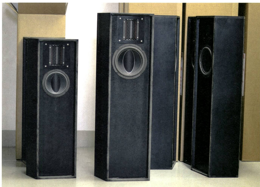
Bild 1 Bipol-Standlautsprecher von Rowen ohne Stoffbespannung. Oben sieht man den für den Hoch- und Mitteltonbereich zuständigen Linear Motion Transformer, darunter den Basstreiber.