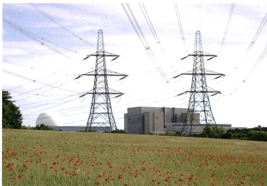
Bild 1 Hinsichtlich der Kernenergie besteht in Grossbritannien weitgehend politische Einigkeit. Im Bild: Kernkraftwerk Sizewell an der englischen Ostküste. Die Anlage A (rechts) wurde 2006 stillgelegt, der Druckwasserreaktor in Anlage B (links) ist noch in Betrieb.

rung vorgeschlagen wurde, unter der momentanen Koalitionsregierung von Konservativen und Liberaldemokraten in mehr oder weniger unveränderter Form vorangetrieben wurde. Der Konsens ist umso erstaunlicher, da die EMR faktisch eine Re-Regulierung der Industrie bedeutet und die Uhren auf die frühen 1990er-Jahre zurückgestellt wurden. Diese Stossrichtung wurde durch die Finanzkrise begünstigt. Seit dem wirtschaftlichen Kollaps glaubt die britische Bevölkerung nämlich nicht mehr daran, dass der freie Markt per Definition wirtschaftlich effiziente Lösungen hervorbringt. Zudem haben die Versorgungsunternehmen ihr Vertrauen bei Endkunden fast gänzlich eingebüsst. Es herrscht die weitverbreitete Meinung, dass die Unternehmen signifikante Profite auf Kosten der wirtschaftskrisen-geplagten Bevölkerung generieren. Dies, obwohl mehrere Studien das Gegenteil beweisen und in England mitunter die schärfsten Bestimmungen der Welt gelten. Die Stimmung im Volk wurde von der Regierung zum Anlass genommen, die Re-Regulierung der Industrie mit beiden Händen voranzutreiben.