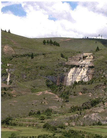
Figure 1 Chute d'Andriambola.

Outre le Cicafe (Centre d'Information, de Communication, d'Animation, de Formation et d'Éducation, une ONG locale), les villageois et les opérateurs privés