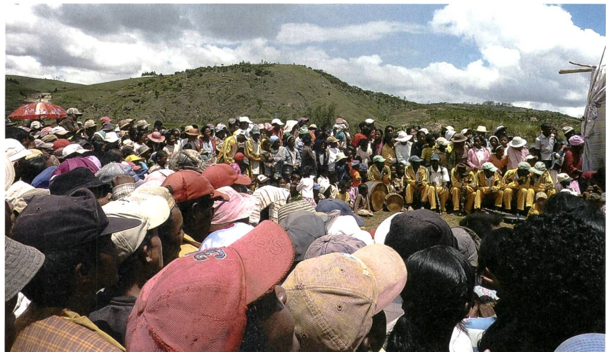
Figure 2 Introduction du projet lors d'une fête organisée par les villageois bénéficiaires du projet pico-Andriambola.