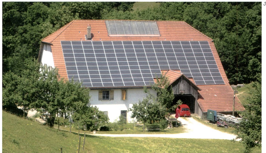
Fotovoltaik-Anlagen erhalten ab Anfang 2014 nur noch während 20 Jahren KEV-Unterstützung.

genehmigungsverfahren (VPeA) gutgeheissen. Damit können Anlagen mit einer Leistung bis zu 30kVA künftig ohne Genehmigung des Eidgenössischen Starkstrominspektorats Esti gebaut werden. Als Ausgleich für die damit wegfallende technische Kontrolle wird eine technische Abnahmekontrolle und eine periodische Kontrolle eingeführt. So können diese Anlagen rasch in Betrieb genommen werden, während gleichzeitig deren Sicherheit ohne grösseren administrativen Aufwand gewährleistet ist. Weiter setzt die Verordnung Massnahmen zur Beschleunigung der Sachplan- und Plangenehmigungsverfahren um. Die revidierte Verordnung tritt am 1. Dezember 2013 in Kraft. Se