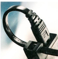
Neue Haltevorrichtung für IEC-C8-Gerätestecker und dazugehöriges Kabel.

Schurter AG, 6002 Luzern Tel. 041 369 34 37, www.schurter.com