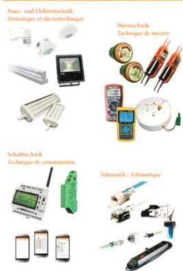
Elbro-Innovationen im Bereich Mess-, Schalt- und Beleuchtungstechnik an der ElectroTec.

Wir liefern Ihnen professionelle Lösungen in diesen vier Bereichen: Nous vous fournissons des solutions professionnelles dans les domaines suivants: