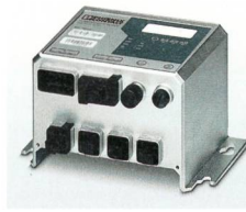
Realtime-Switch mit drei Polymerfaser-Ports für störteste LWL-Strukturen.