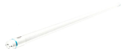
Die LEDtube InstantFit EVG gibt es zunächst als Ersatz für die 1200-mm-Leuchtstofflampe.

Philips AG Lighting, 8027 Zürich Tel. 044 488 21 79, www.philips.com