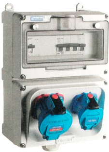
Die Marechal-Baureihe ist kompakt und robust mit Stossfestigkeitsgrad IK09.

ISV Industrie-Steck-Vorrichtungen GmbH DE-77731 Willstätt-Sand Tel. 0049 7852 91 960, www.isv.de